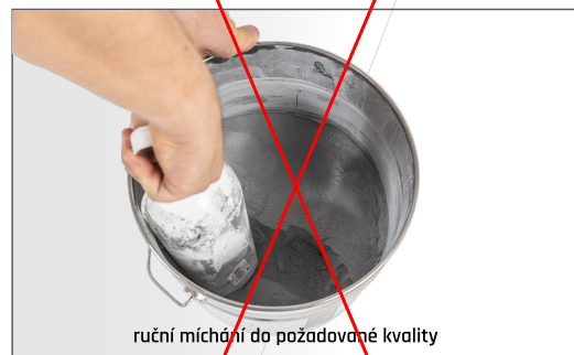
ruční míchání do požadované kvality