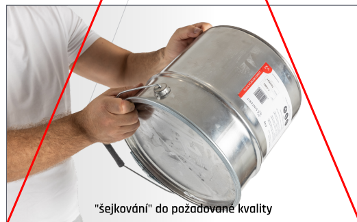
"šejkování" do požadované kvality

Jakákoli varianta ručního refreshování je fádní a časově náročná