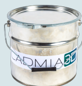
Kbelík 12 l

Součástí balení cadMIXu je i potřebné příslušenství, které vám umožní začít okamžitě pracovat.