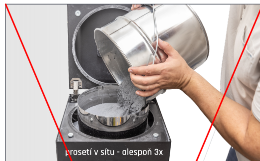
prosetí v sítu - alespoň 3x